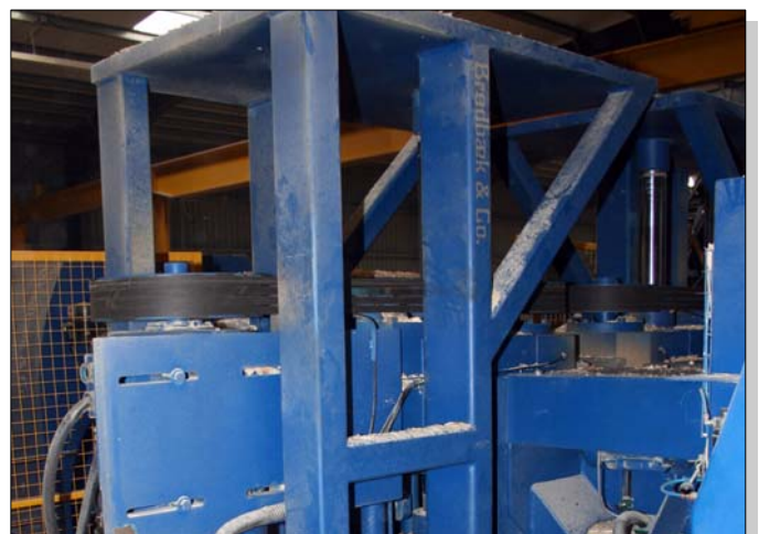
Das neue Profilieraggregat Typ BCO 300