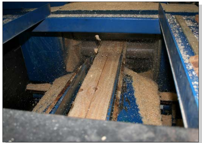
Brettabscheider nach dem Besäumer