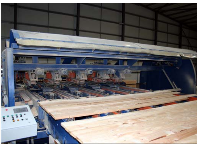
Durchlaufkappsäge BCO 5/100 mit geöffneter Schutzhaube