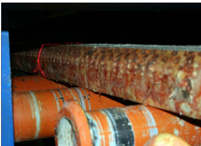
3D Model Scanner mit Microtec DiShape