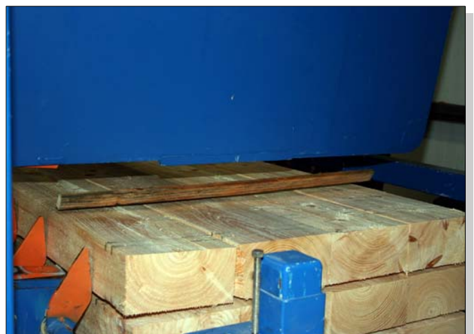
Stapelung von Hauptware 100 x 300 mm