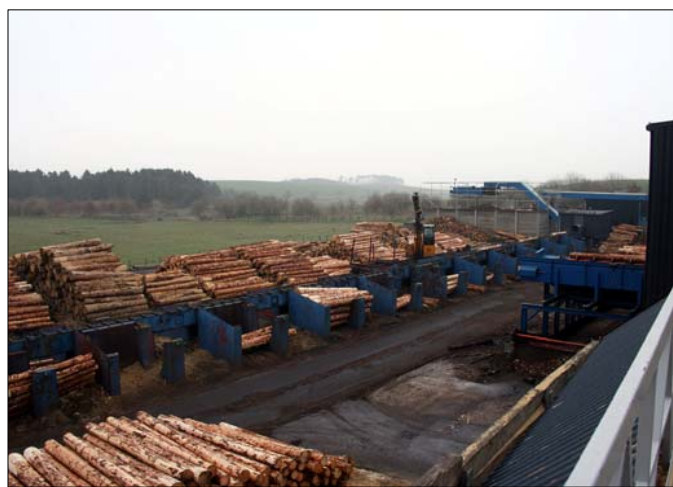
Teilansicht der Rundholzanlage – rechts im Bild die Rundholzaufgabe zur Sägelinie