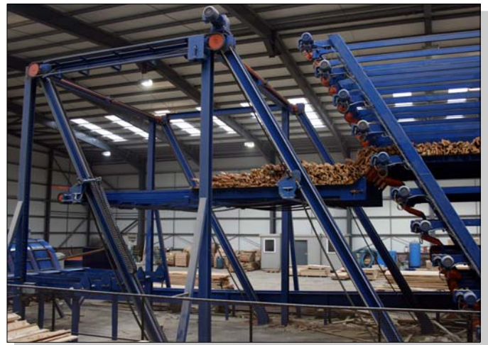
Entleerung einer Etage