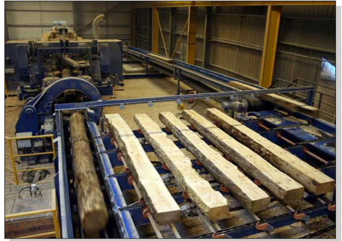
Modelpuffer beim Rundlauf vor dem 2. Durchgang in die Sägelinie