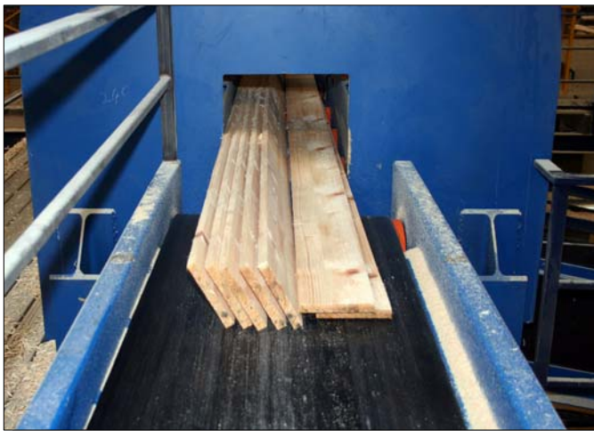
Hauptwarenauslauf an der Nachschnittsäge Typ BCO 1000/180