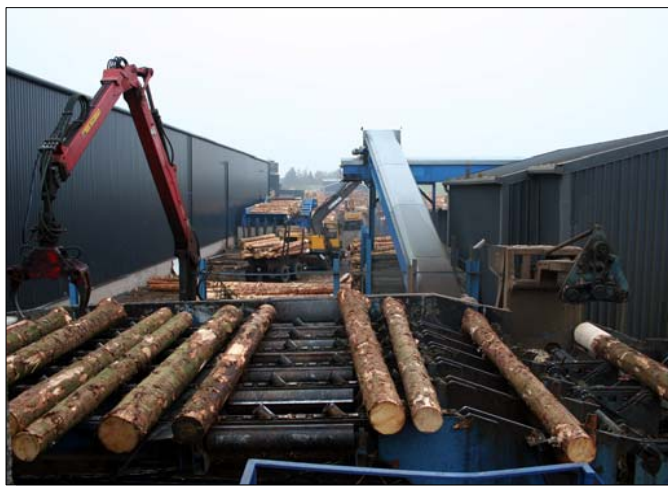
Rundholzanlage mit Wurzelreduzierung vor der Sortierung