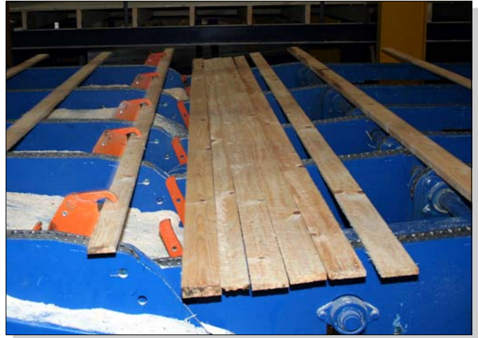
Der BCO Speed Feeder – Brettzuteilung mit sicherem Griff