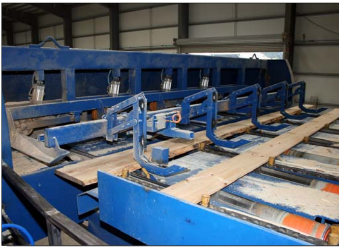
Bretteinzug in Besäumer Typ BCO 800/60